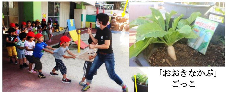
「おおきなかぶ」 ごっこ